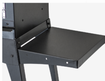
Option : Tablette latérale